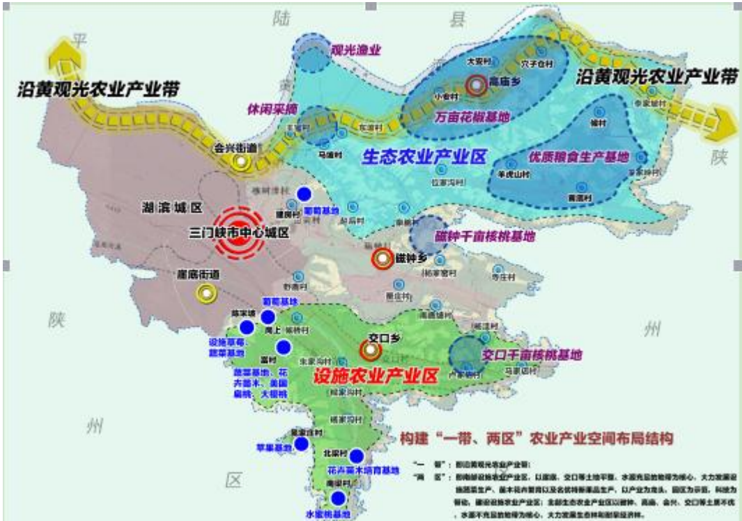
湖滨区农业产业空间布局规划图

强化就业创业服务。 深入实施全民技能振兴工程，着力提高劳动者就业创业能力，加强市场引导培训，促进就业。坚决落实好各项培训惠民政策，力争每年培训 3000 人次以上。积极对接三门峡市技能培训中心，协调组织湖滨区返乡下乡创业辅导专家服务团队，结合湖滨区实际，开设湖滨区特色创业辅导班。